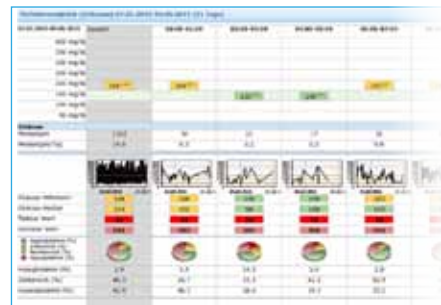
Periodevergelijking In één oogopslag; weken, kwartalen, 14 dagen, weekdays, tijdsperiodes