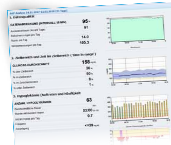
AGP-analyse Analyse van het glycemische profiel aan de hand van verschillende criteria