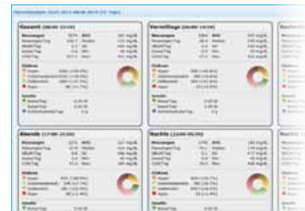
Analyse op bepaalde tijdstippen In één oogopslag: 's morgens, 's middags, in de namiddag, 's avonds en 's nachts