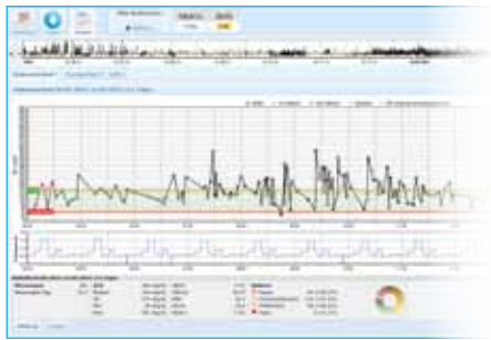
Glucoseverloop Glucosespiegelverloop met insuline, basale dosering, voeding, sport, ...