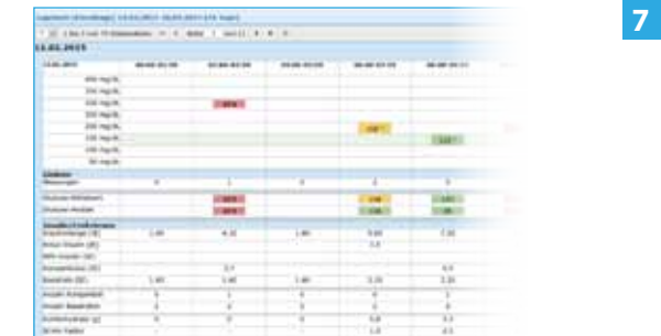
Dagboek Weergave als glucosedagboek