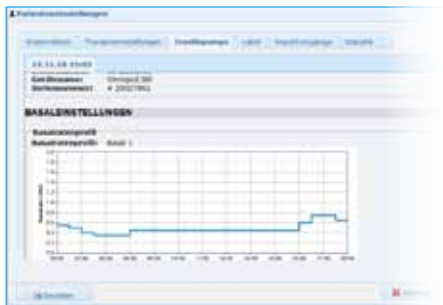
Pompinstellingen Beheer van basale doseringsprofielen en instellingen van diverse insulinepompen